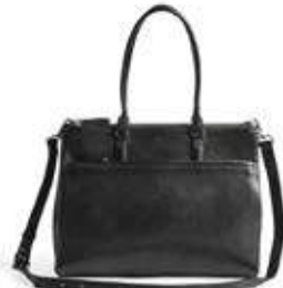
JUNIPER BAG ANB. B2B PRIS DKK EX. MOMS 640,-