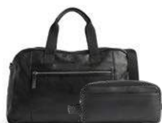
WESLEY WEEKEND BAG + DOMINIC TOILETRY BAG ANB. B2B PRIS DKK EX. MOMS 800,-