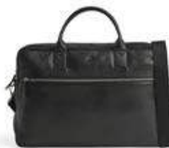
VINCENT 14" LAPTOP BAG ANB. B2B PRIS DKK EX. MOMS 560,-