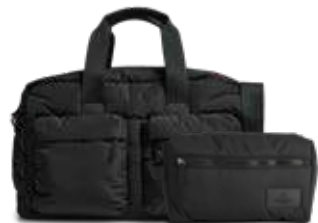
MORE WEEKEND BAG + JOSEPHINE TOILETRY BAG ANB. B2B PRIS DKK EX. MOMS 560,-