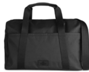
INDY WEEKEND BAG ANB. B2B PRIS DKK EX. MOMS 300,-