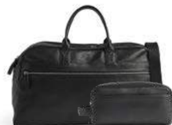
THEODORE WEEKEND BAG + DOMINIC TOILETRY BAG ANB. B2B PRIS DKK EX. MOMS 960,-