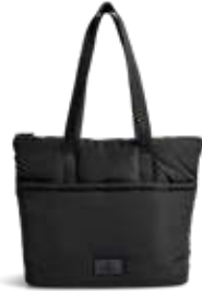
PERRY SHOPPER ANB. B2B PRIS DKK EX. MOMS 300,-