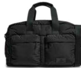
MORE WEEKEND BAG ANB. B2B PRIS DKK EX. MOMS 400,-