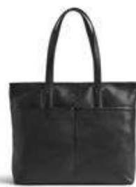
MOLINA SHOPPER ANB. B2B PRIS DKK EX. MOMS 400,-