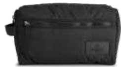
JOSEPHINE TOILETRY BAG ANB. B2B PRIS DKK EX. MOMS 250,-