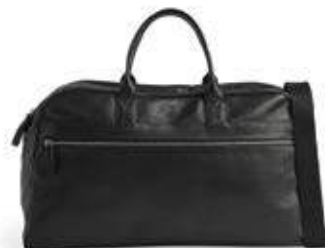
THEODORE WEEKEND BAG ANB. B2B PRIS DKK EX. MOMS 800,-