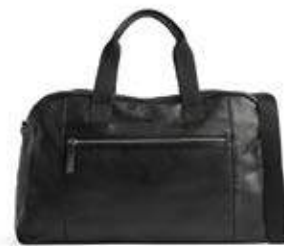
WESLEY WEEKEND BAG ANB. B2B PRIS DKK EX. MOMS 640,-