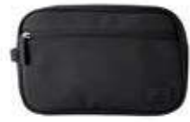
SIMON TOILETRY BAG ANB. B2B PRIS DKK EX. MOMS 200,-