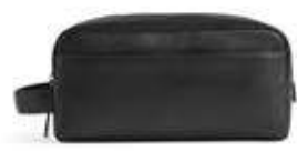
DOMINIC TOILETRY BAG ANB. B2B PRIS DKK EX. MOMS 250,-