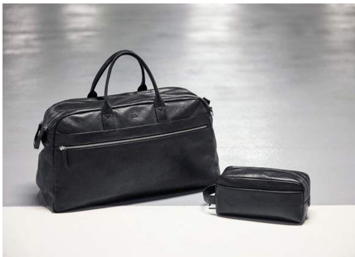
THEODORE XL WEEKEND BAG + DOMINIC TOILETRY BAG