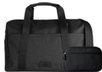
INDY WEEKEND BAG + SIMON TOILETRY BAG ANB. B2B PRIS DKK EX. MOMS 400,-