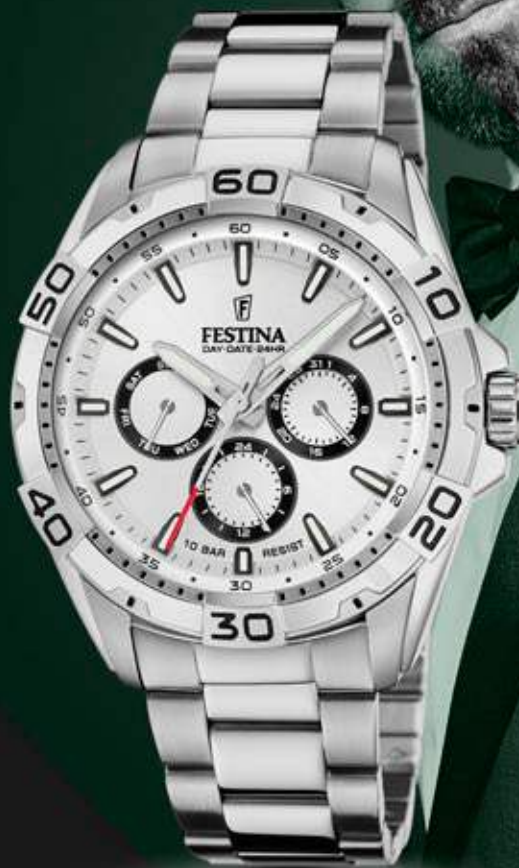
F20623/1 ANB. B2B ERHVERVSPRIS 560,- VEJL. PRIS: 998,-