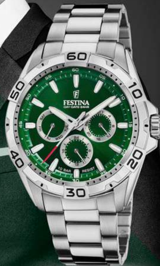
F20623/3 ANB. B2B ERHVERVSPRIS 560,- VEJL. PRIS: 998,-