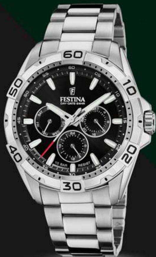
F20623/5 ANB. B2B ERHVERVSPRIS 560,- VEJL. PRIS: 998,-