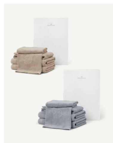
GAVE 3 M