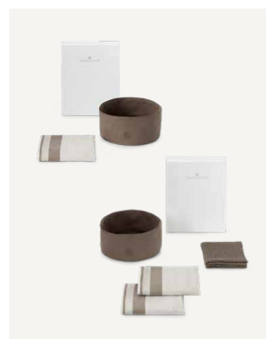
GAVE 1 A / B