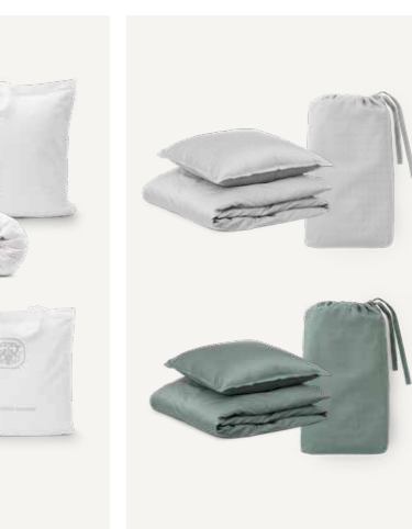
GAVE 14 A/B/C/D