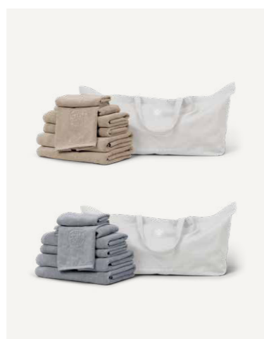
GAVE 3 L