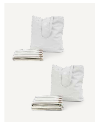
GAVE 6 A / B