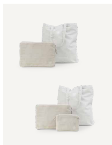
GAVE 2 A / B