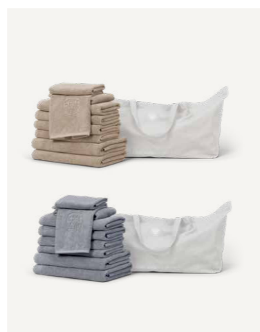
GAVE 3 XL