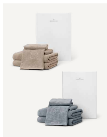
GAVE 3 S