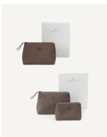
GAVE 5 A / B