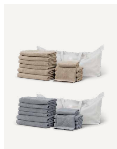
GAVE 3 XXL