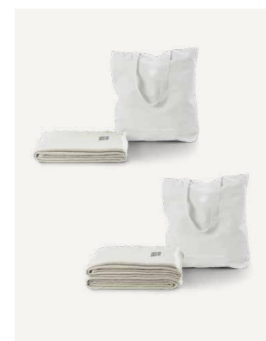
GAVE 11 A / B