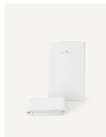
GAVE 10 A / B