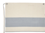
Stripes Apron, Short 1940201 100% Organic Cotton WxL: 92x69 cm Whisper White/Light Grey

Stripes Tea Towel er skabt af 100% økologisk bomuld i et enkelt, men tidsløst design, der leger med skalaen og udtrykket i de klassiske Bretagne striber. Designet udspringer af ideen om at skabe en kollektion, der bringer elementer fra modeverdenen ind i køkkenet på en balanceret og elegant facon.