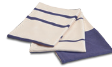
Stripes Tea Towel 1940105 100% Organic Cotton WxL: 68x49,5 cm Whisper White/Dark Blue 3 pcs.

Fulla er en opbevaringsserie med låg, hvor den geometriske cylinder er skabt med en mat overflade. Fulla Saltkar er åbenlyst praktisk med den lave åbne form, den lille serverings ske og låget, du kan lukke.