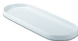
Nordic Serving Plate S1600283 Porcelæn LxDxH 40x15x2,5 cm

Nordic Skål Ø20 har samme lave og åbne form som resten af de anvendelige skåle i serien, der er designet af VE2. Det matte og glatte spil mellem yderside og inderside giver den kridhvide serie sin stoflige kvalitet, og Nordic-serien tåler ovn, mikroovn og opvaskemaskine.