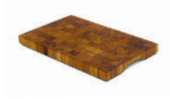
Cutting Board 33x21 S1990891 Teak Endgrain LxDxH: 33x21x2,5 cm

Pakket i gavepose Vejl. pris DKK 1499,85 Vejl. B2B pris DKK 560,00