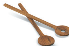
Salad Servers S1990837 Teak LxDxH 30x6x0,9 cm

Nordic Serveringsfad er et aflangt fad med rundede hjørner, der både fungerer som servering og som undertallerken til seriens mindre skåle. Nordic Servingsfad har seriens matte yderside og blanke inderside og tåler ovn, mikroovn og opvaskemaskine. Designet af VE2.