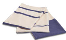
Stripes Tea Towel 1940105 100% Organic Cotton WxL: 68x49,5 cm Whisper White/Dark Blue 3 pcs.

Cutting Board er skabt af træets kvadratiske endestykker, så træets årer danner grafiske konstellationer på kryds og tværs. Cutting Board har indbyggede greb på undersiden af brættet, så du kan bære det sikkert til bords. Træets fibre vender opad på endetræ, hvilket minimerer slid på knive såvel som synlige ridser i overfladen.