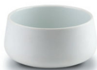
Nordic Bowl Ø20 S1600264 Porcelæn ØxH 20x10 cm

Pakket i gavepose Vejl. pris DKK 1119,85 Vejl. B2B pris DKK 560,00